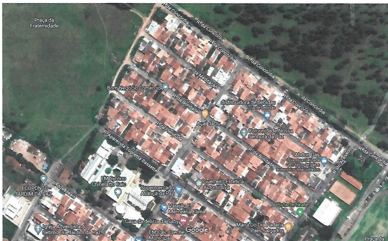
Imagens ©2022 CNES / Airbus, Maxar Technologies, Dados do mapa ©2022 50 m