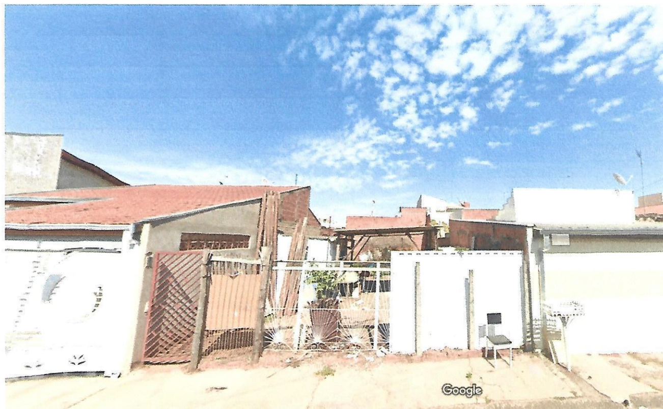
Captura da imagem: jul. 2019